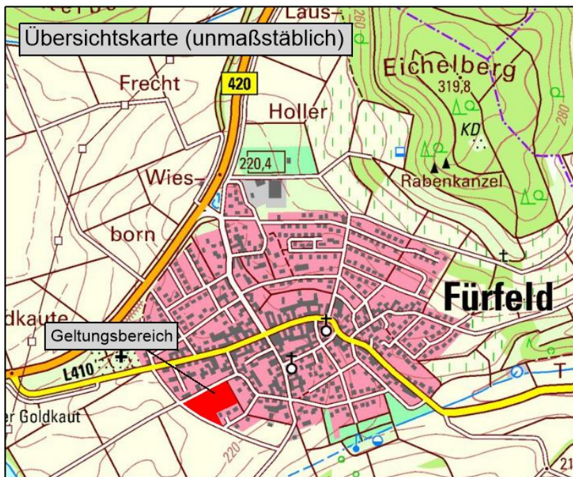
Abb. 1: Siedlungslage von Fürfeld mit Markierung der Lage des Geltungsbereichs (unmaßstäblich).

Die Lage des räumlichen Geltungsbereichs ist in vereinfachter Form Gegenstand der nachstehenden Abbildung