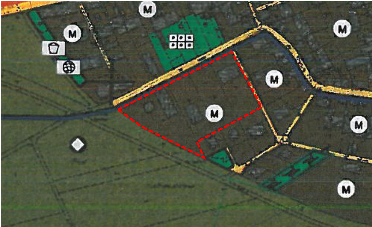
Abb. 3: Auszug aus dem wirksamen FNP der Verbandsgemeinde Bad Kreuznach mit Markierung des Geltungsbereiches der vorliegenden Bebauungsplanung (unmaßstäblich).

Im wirksamen Flächennutzungsplan (FNP) der Verbandsgemeinde Bad Kreuznach ist das Plangebiet als Fläche für gemischte Bauflächen dargestellt (s. Abb. 3).