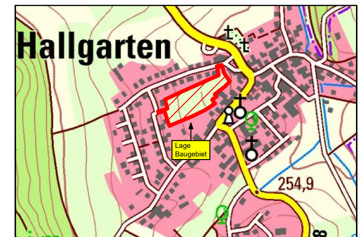
ÜBERSICHTSKARTE M. 1 : 10 000